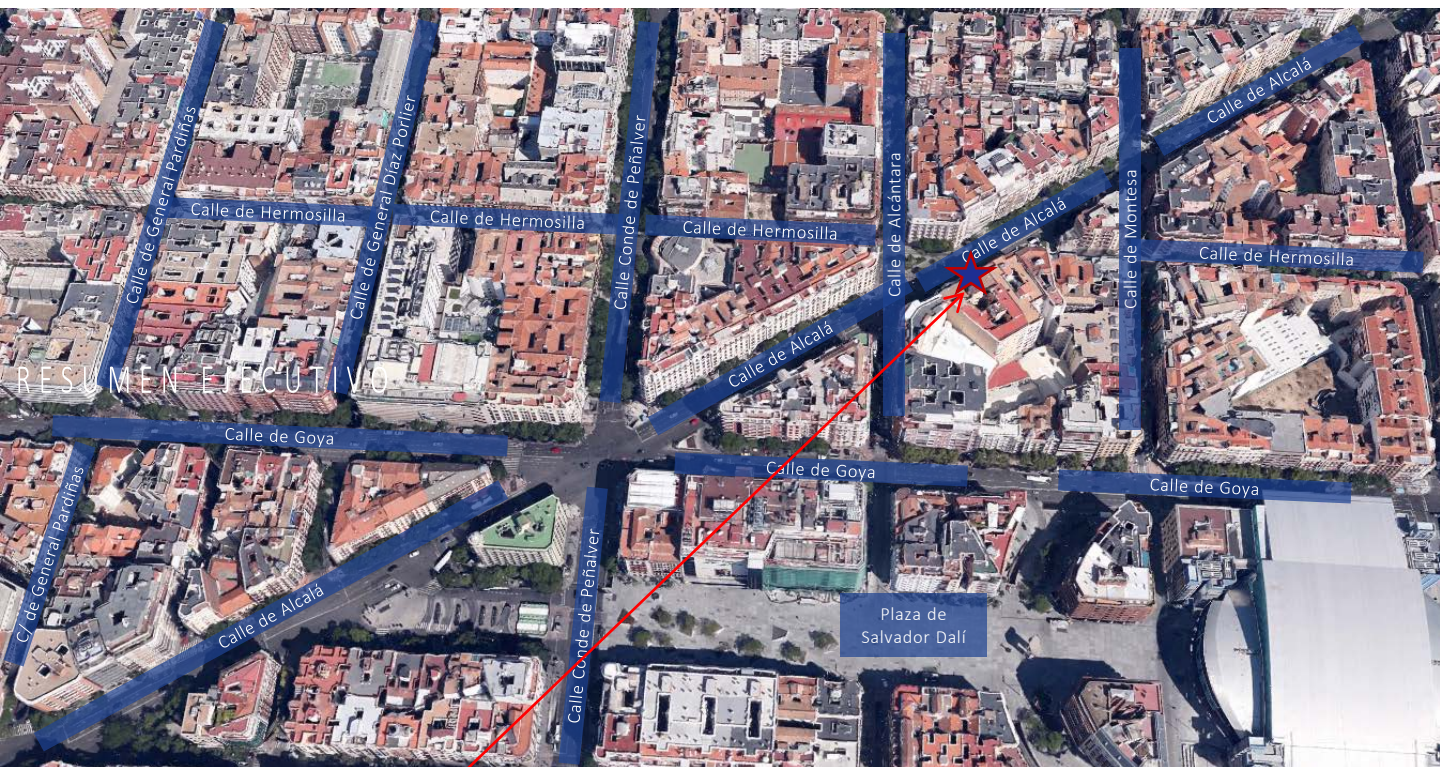
Local Alcalá 108